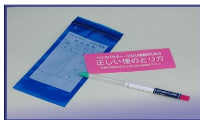
ピロリ菌採取器具

しかし、ピロリ菌除菌の治療を行うことで、潰瘍の再発防止、胃がん発症のリスクが低下するなど、胃の状態改善が期待できます。